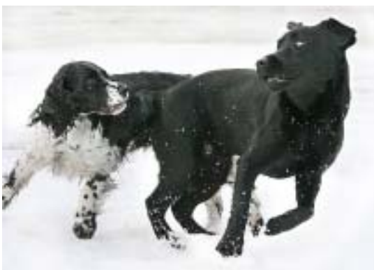
Hundens farge og bakgrunnen