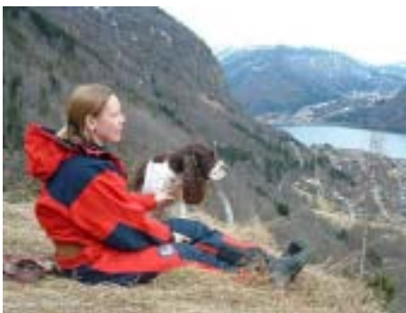
Det gyldne snitt