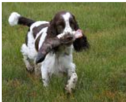
Se inn i / løpe inn i bildet