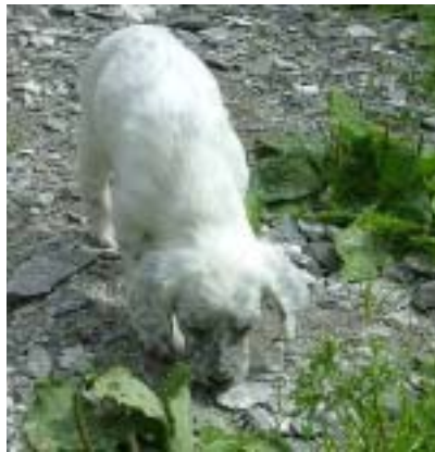
Ikke ovenfra og ned!